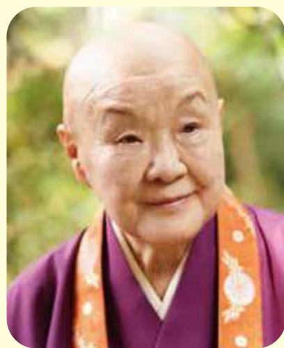
瀬戸内 寂聴 作家