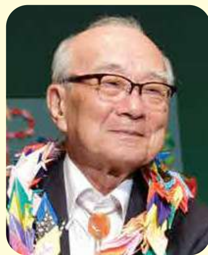
田中 熙巳 日本原水爆被害者団体協議会代表委員